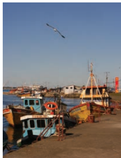
Figura 6 Imagen del muelle donde se dejan las embarcaciones menores utilizadas para labores de pesca artesanal.

los espacios públicos en estos casos ha sido funcional a la subsistencia y que se trataría de una dimensión históricamente desarrollada. (Knapp. 1992:113)