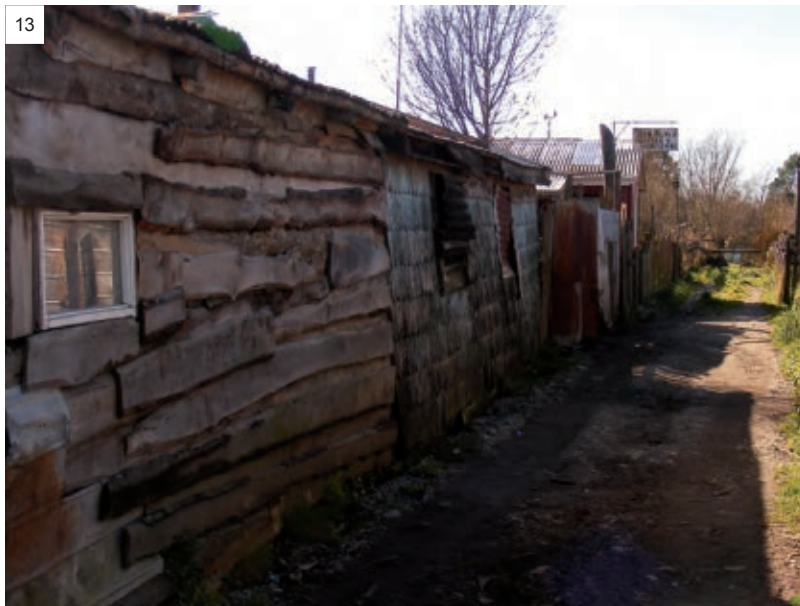
Figura 11: Vista exterior del acceso compartido a un conjunto de cuatro viviendas / Figura 12: Vista exterior del patio común de reparación de vehículos / Figura 13: Pasaje de acceso común a patios y viviendas / Fotos: C. Silva.