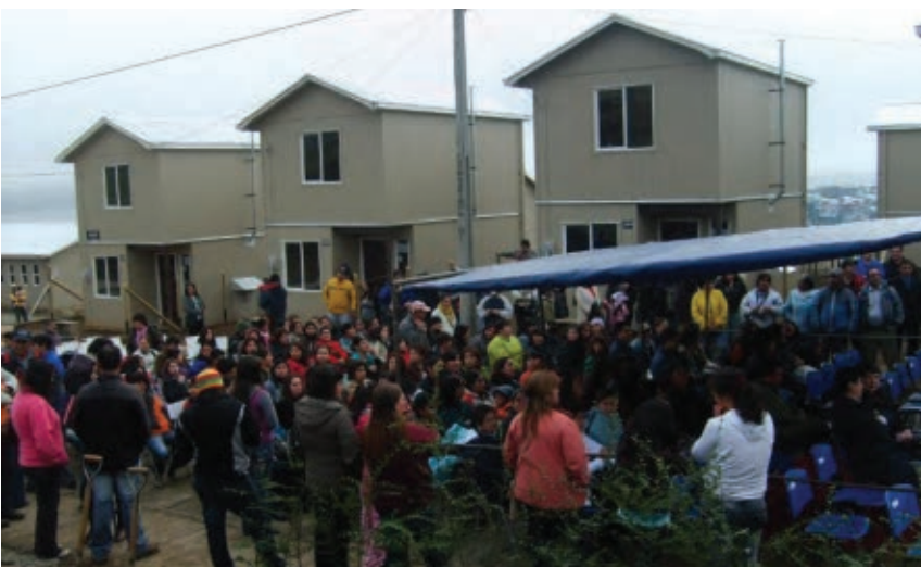
Figura 5 Imagen de las viviendas entregadas por el SERVIU Regional a los pobladores de los campamentos en Ancud.