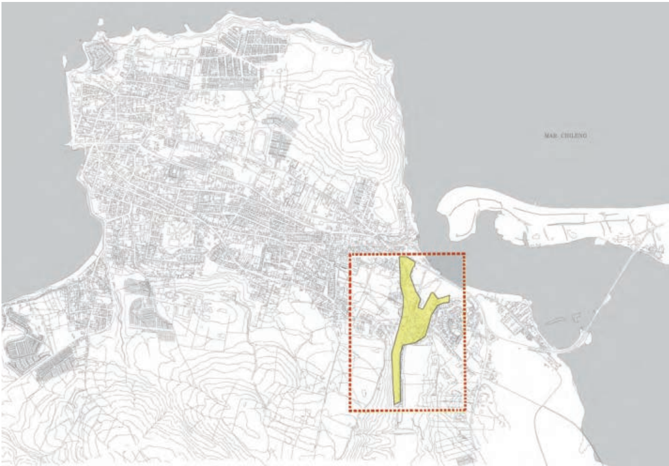
Figura 1 Plano de la ciudad de Ancud. En amarillo el área edificada del campamento de Pudeto Bajo. Plano base Plan Regulador Comunal de Ancud. I. Municipalidad de Ancud 2002. Fuente: I. Municipalidad de Ancud. Edición: Arquitecturas del Sur

Emplazado históricamente al fondo de una entrante de agua que penetra desde el río Pudeto hacia el interior, este cauce de agua permite el acceso y salida de algunas embarcaciones menores, la aparición de pequeños muelles, patios de trabajo y espacios para el guardado de herramientas, así como notorios humedales laterales que rodean al asentamiento generando y que generan una distancia física con la ciudad. Por estos sectores del humedal, actualmente pasan calles que conectan con otros barrios y lugares y en donde se da el acceso al comercio y prestación de servicios de los pobladores del campamento.