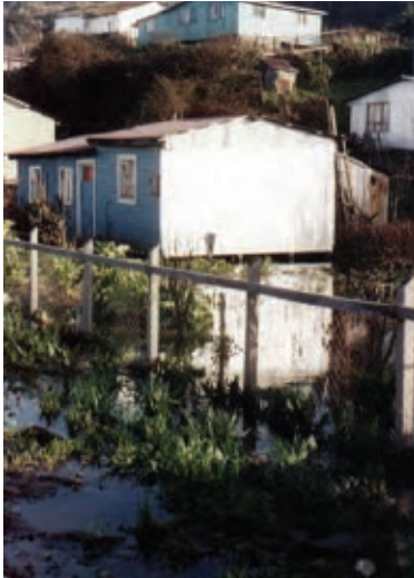
Figura 3 Imagen interior del campamento. Se pueden apreciar las áreas inundadas.