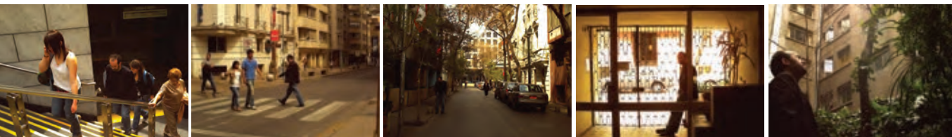
Secuencia: Desde la estación de metro Bellas Artes hasta el patio de mi departamento en calle Mosquito, Santiago.