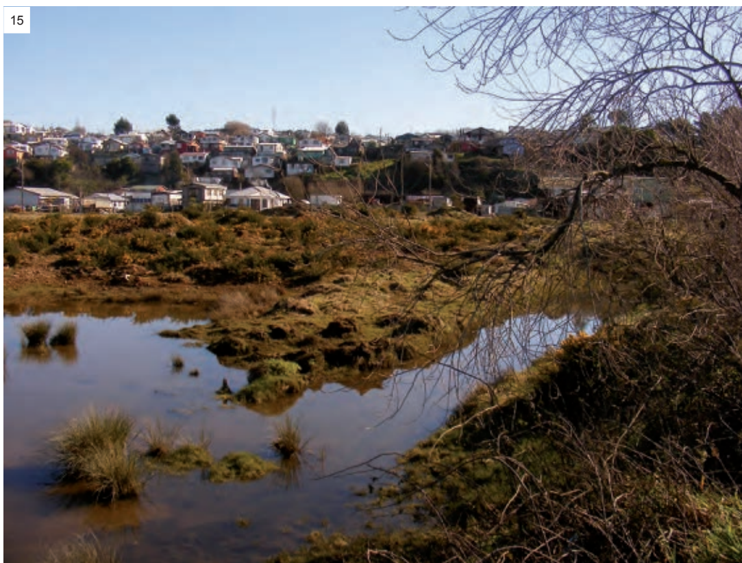
Figura 14: Acercamiento al área del humedal. / Figura 15: Área baldía de separación entre la ciudad y el asentamiento.