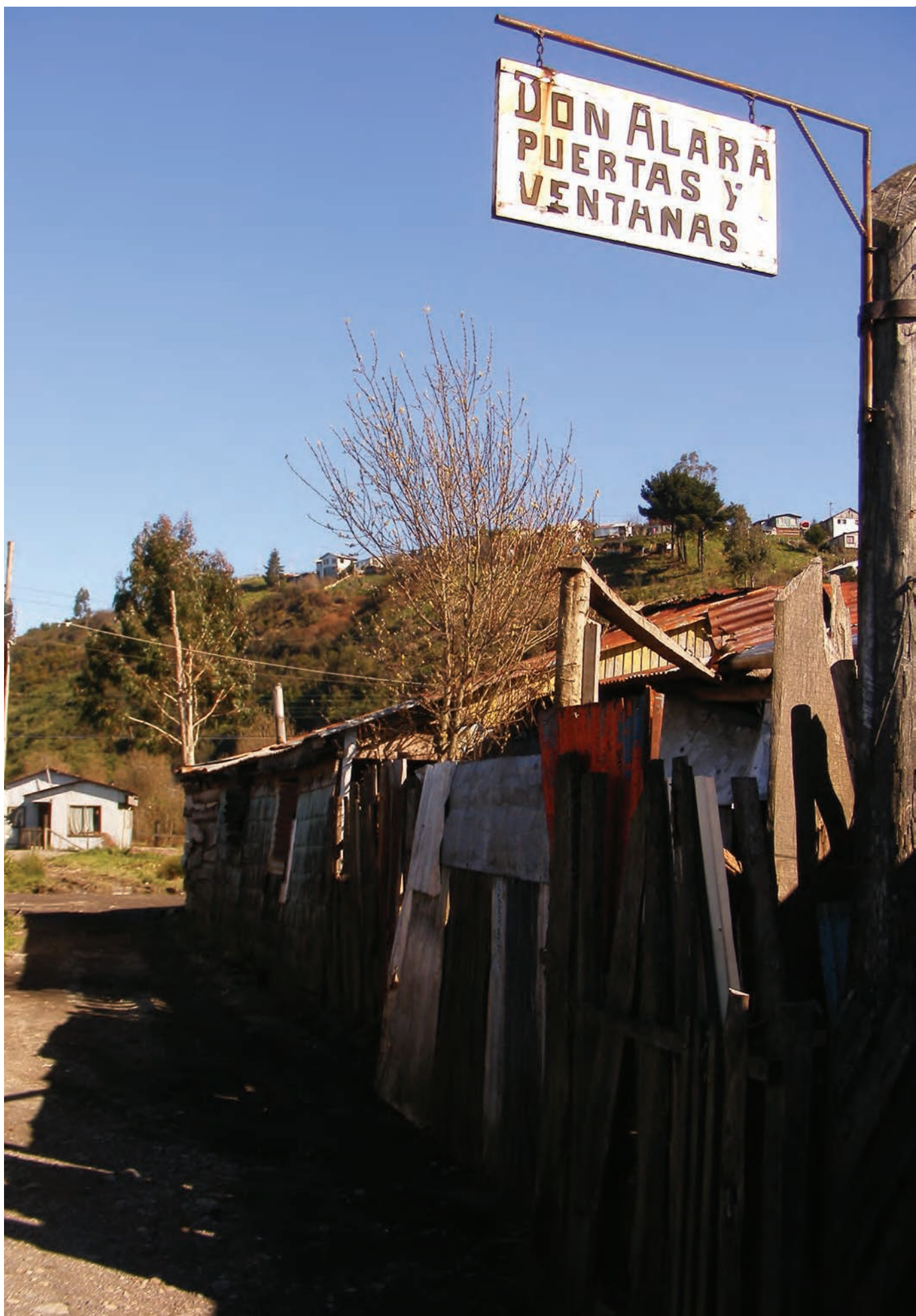
Figura 0 Campamento de Pudeto Bajo .