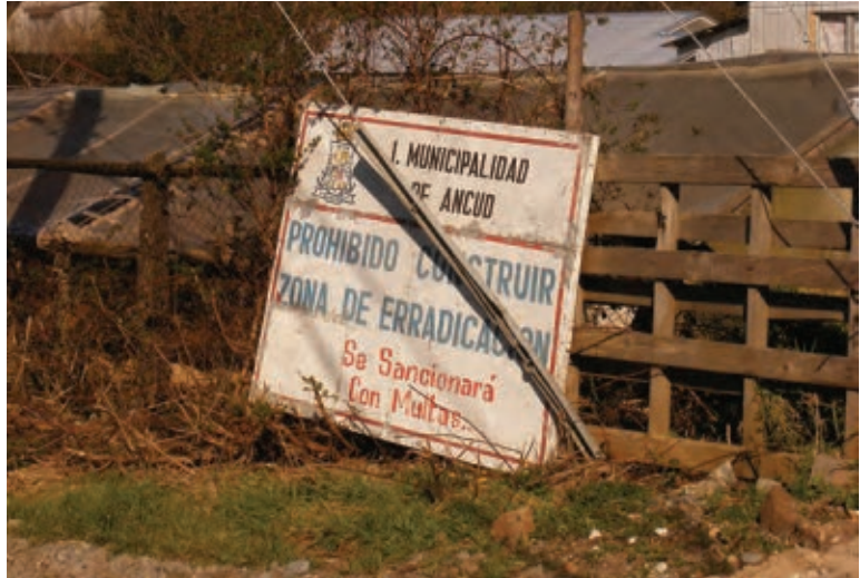
Figura 4 Imagen del aviso de prohibición a la construcción y declaración de zona de erradicación.

los habitantes obtienen viviendas de calidad, al mismo tiempo pierden su principal medio de subsistencia. (Figura 5)