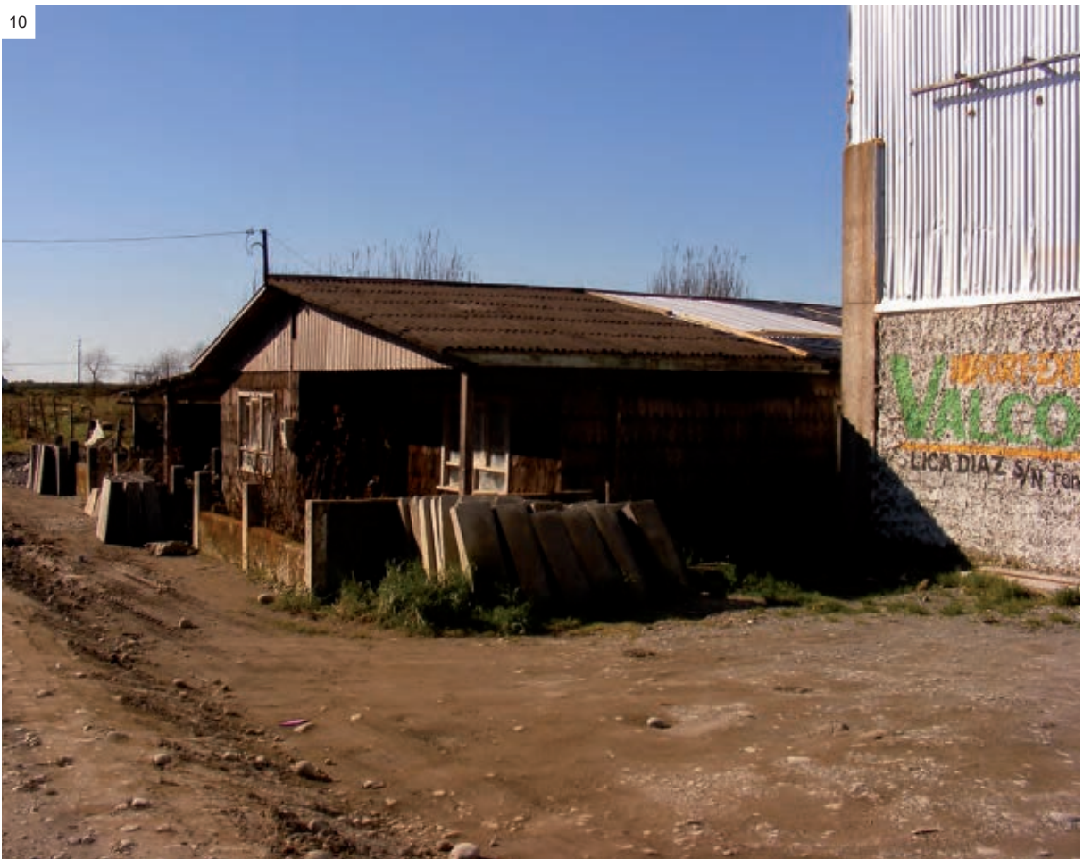
Figura 7: Patio interior de reparación y construcción de embarcaciones. / Figura 8: Patio interior común de invernaderos para el almacenaje y secado de pelillo. / Figura 9: Pasaje interior del campamento en que se muestran las instalaciones sanitarias precarias y las redes de agua potable. / Figura 10: Patio de ventas de productos de hormigón. / Fotos: C. Silva.